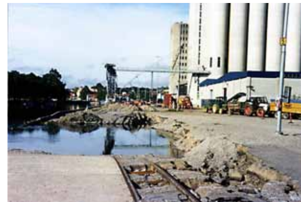
Överst: Societetsparken på 1860-talet. Ovan: ett slukhål i kajen där underlaget rasat undan.

till Norrtälje sedan staden betalt en engångsavgift på 200 kronor till Bältartorp.