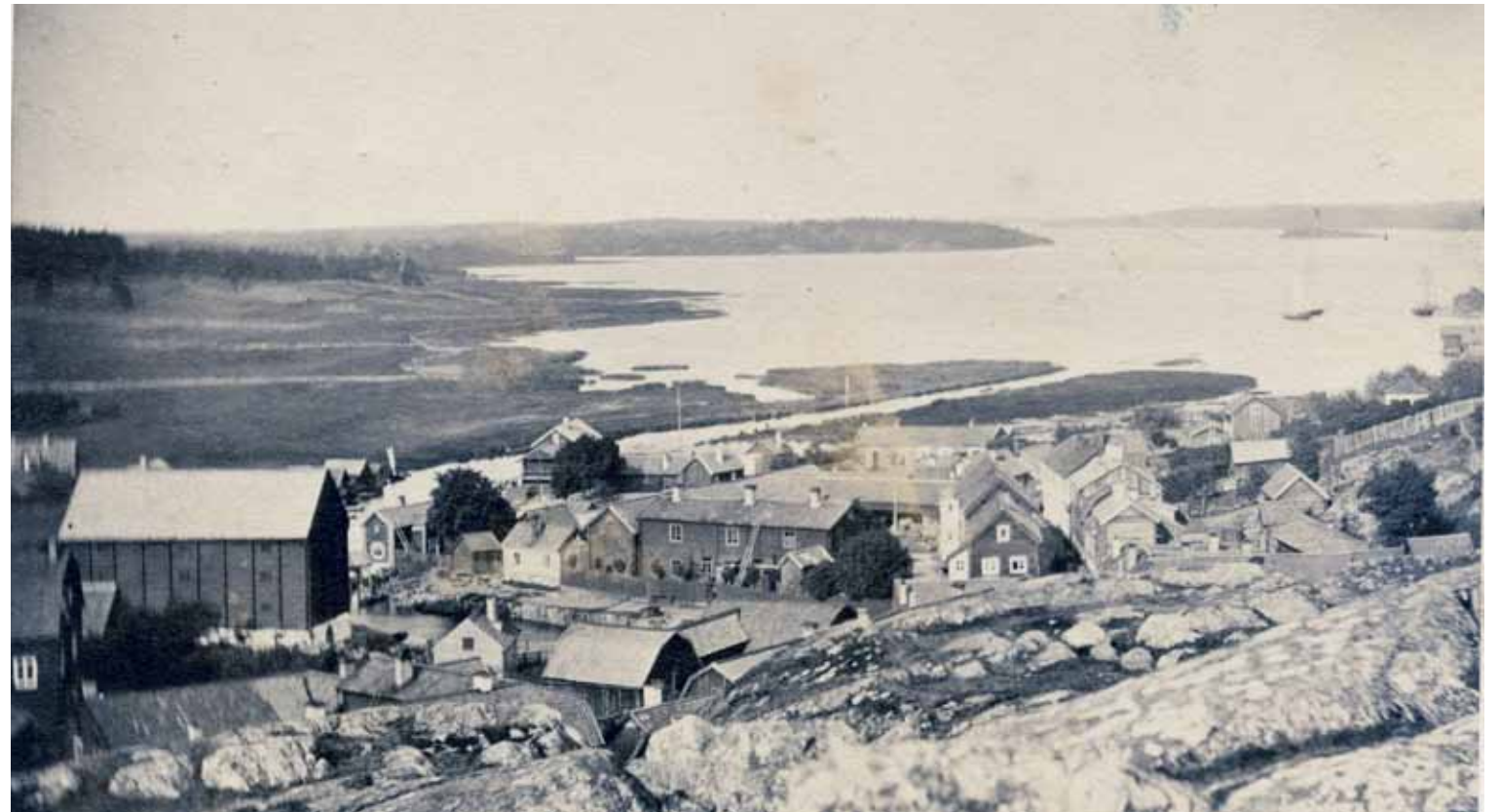
Området som ska bli hamn var ännu på 1860-talet ett deltalandskap av vassruggar och dybankar. Längst till höger ses ett mindre segelfartyg lägga till vid bryggan intill badhuset.

Redan 1838 får Norrtälje reguljär ångbåtsförbindelse med Stockholm och Öregrund. Det är hjulångaren Elida som under några sommarmånader upprätthåller trafiken. Nu skäms Norrtäljeborna över att passage-rarna måste kliva iland på en klippställning och sedan gå nästan en kilometer längs en sönderkörd stig för att komma till staden.