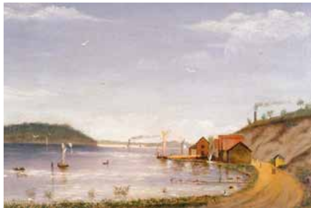
Överst: Staden sedd från Åmundsberget. Ovan: Ångbåtshamnen vid badhuset.

och dybankar in till "lastageplatsen". Större fartyg fick lov att ankra ute vid Borgmästarholmen och föra iland eller ombord sitt gods från småbåtar.