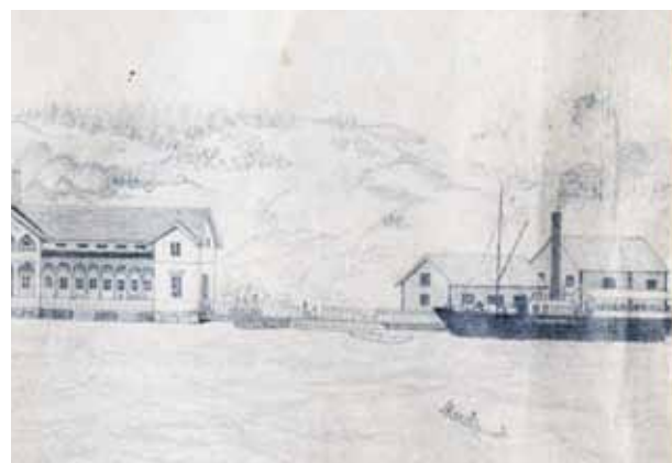
Ångfartyget Wingåker vid ångbåtsbryggan 1866.

Först år 1881 började man arbetena på det vi idag kallar Norrtälje hamn. Problemet var att bara den allra innersta delen av den tilltänkta hamnen tillhörde Norrtälje stad. Den största markbiten tillhörde Bältartorp, som låg i Frötuna socken. År 1884 tog stadsfullmäktige beslut om att ett område längs Bältartorps strand ska föras över till staden. Detta för att "... hamnplatsen