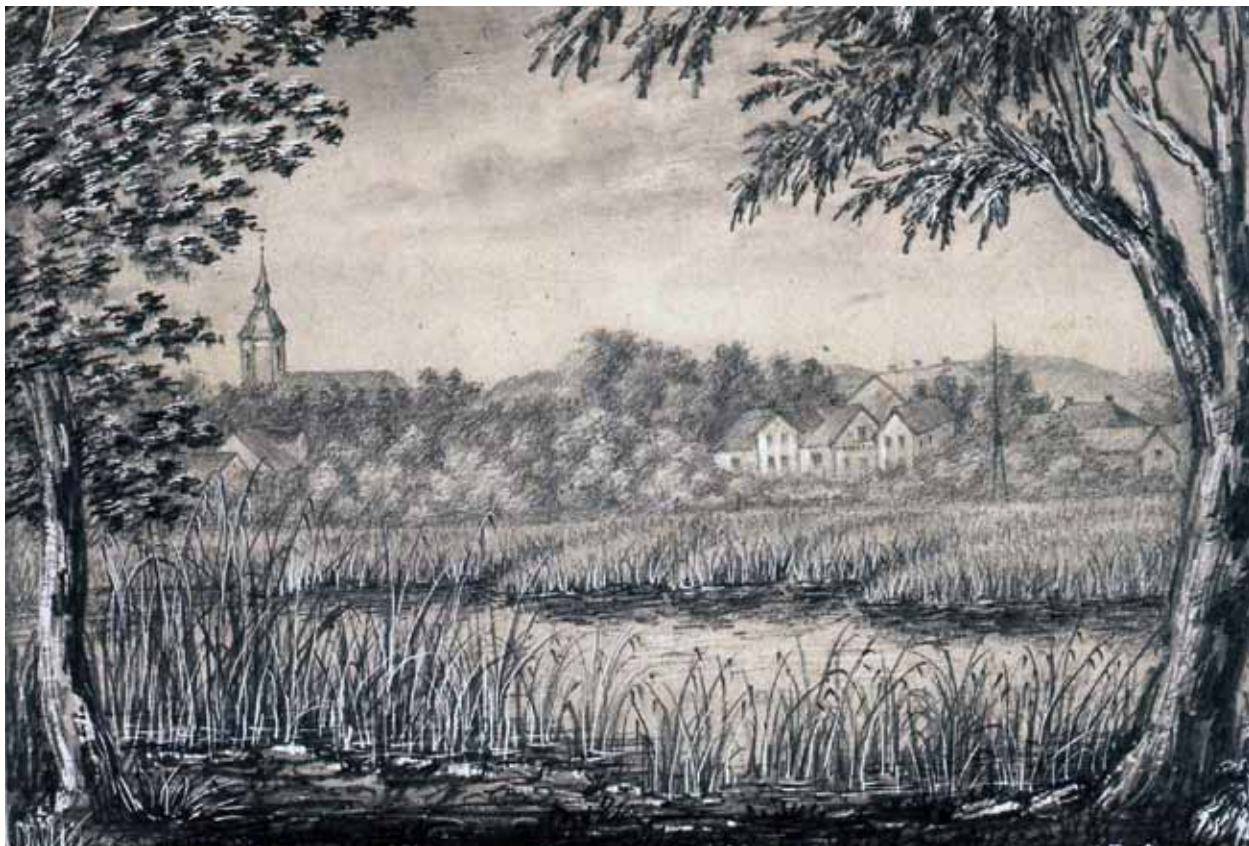
Brännäset sett från den blivande Societetsparken, ca 1860.

nytta för det allmänna. Ville Norrtälje ha en ny hamn så fick man därför bekosta den själv.